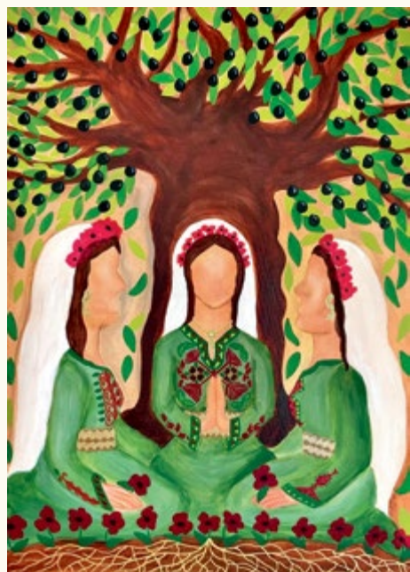
Praying Palestinian Women (Betende Palestinenserinnen)

© World Day of Prayer International Committee, Inc.