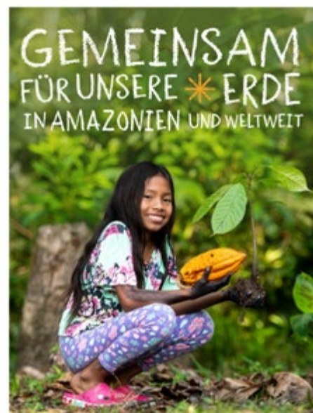
AKTION DREIKÖNIGSSINGEN 2024 * C+M+B+24 Kooperationspartner: Die Sternsinger (Bund der Deutschen Sternsinger Jugend (DSJ)) www.sternsinger.de

In Amazonien sowie in vielen anderen Regionen der Welt setzen sich Partnerorganisationen der Sternsinger dafür ein, dass das Recht der Kinder auf eine geschützte Umwelt umgesetzt wird. Die kolumbianische Stiftung „Wege der Identität“ („Fundación Caminos de Identidad“, kurz FUCAI) arbeitet seit rund zwanzig Jahren mit den Menschen in der Amazonasregion. Dabei gehören die Sorge um die Natur, der Erhalt guter Traditionen und die Entwicklung neuer Perspektiven zusammen. FUCAI organisiert sogenannte „Aulas Vivas“, „lebendige Klassenzimmer“, in denen sich Kinder, Jugendliche und Erwachsene begegnen, um miteinander und voneinander zu lernen. Sie erfahren, wie nachhaltige Bewirtschaftung die Brandrodung ersetzen kann, legen Waldgärten an und lernen, was zu einer gesunden Ernährung gehört. Auch traditionelle Tänze und Bräuche sind feste Bestandteile der Aulas Vivas.