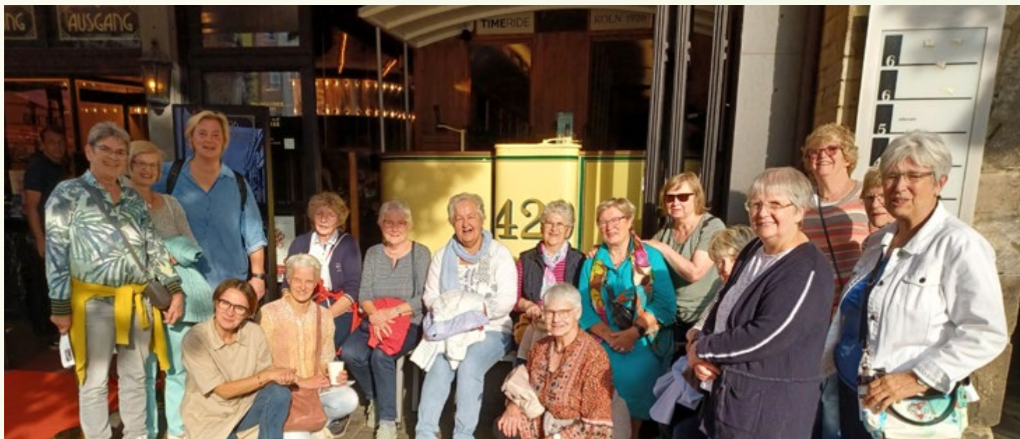
kfd Mitarbeiterinnen vor dem Timeride