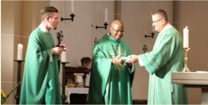
Abschied von Pfarrer Ahokou