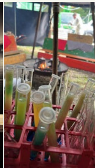
Labor Wipperra mit angemischtem Lebenselixir

dadurch möglichst erfolgreich zu sein. Wenn die Läufergruppen bereits einige Stunden unterwegs sind, dann freuen sie sich besonders darüber, sich am Feuer aufzuwärmen, bei einem reichhaltigen Essen neue Energie zu tanken oder auch über eine Schmerztablette und ein nettes Gespräch mit neuen Bekanntschaften. Es war großartig zu sehen, wie nicht nur in den Läufergruppen, sondern auch bei uns als Stationsteam aufeinander geachtet wurde. Die Wipperaner zeigten sich an diesem langen Wochenende als